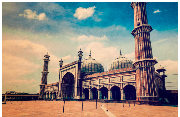
Jama Masjid, Delhi