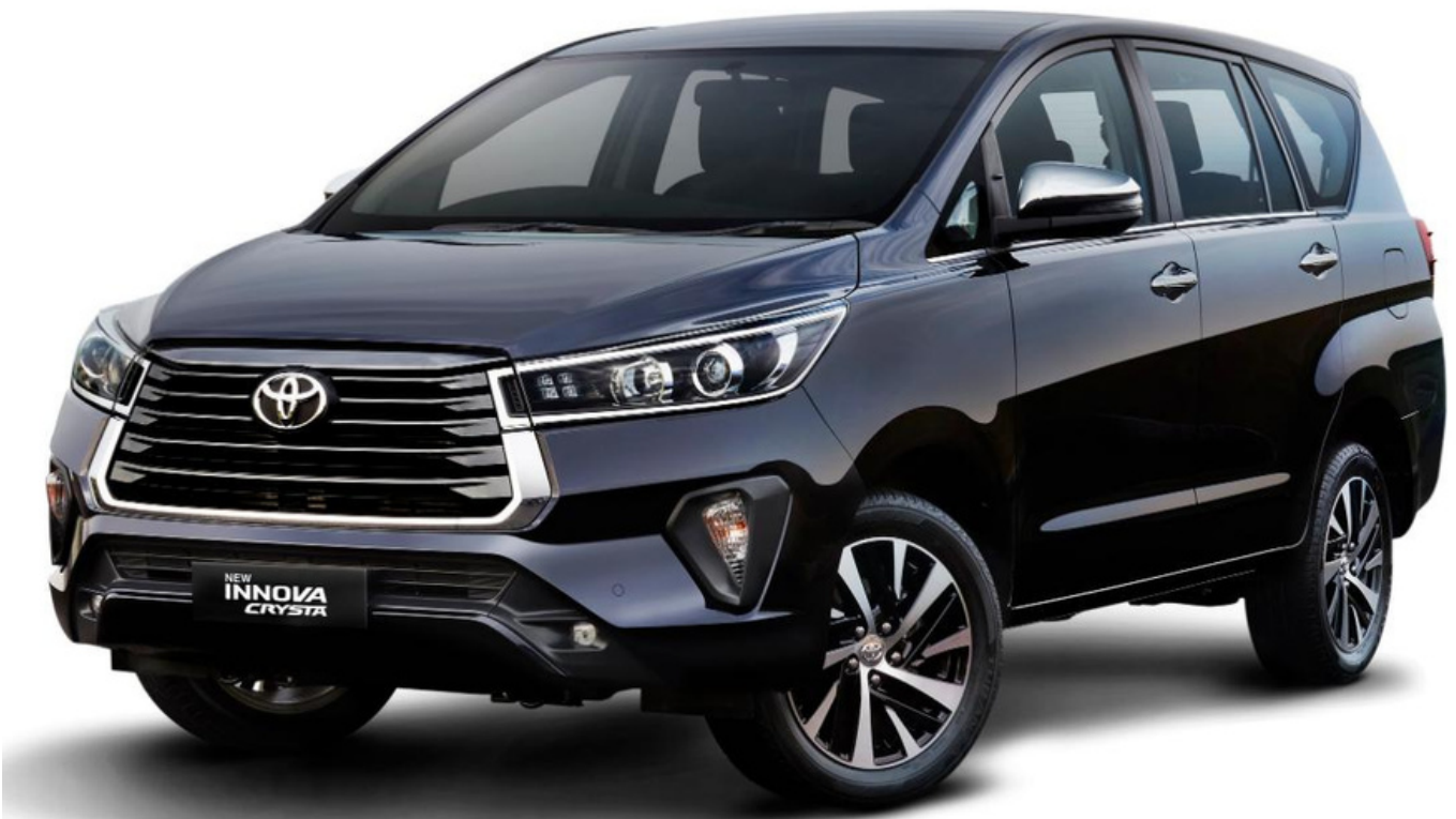
Toyota Innova Crysta