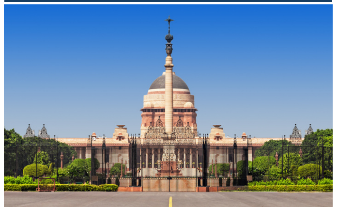
President's Palace, New Delhi