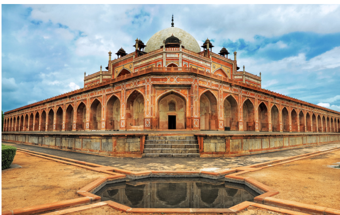
Tomb of Humayun., New Delhi

Fahren Sie am Roten Fort vorbei in Richtung Jama Masjid, der großen Moschee von Alt-Delhi. Sie ist die größte Moschee in Indien und das letzte architektonische Meisterwerk von Shah Jahan. Begonnen im Jahr 1644, wurde die Moschee erst 1658 fertiggestellt. Sie hat drei große Tore und zwei 130 Fuß hohe Minarette, die aus abwechselnden vertikalen Streifen aus rotem Sandstein und weißem Marmor erbaut sind. Der Innenhof der Moschee bietet Platz für 25.000 Menschen, und breite Treppen führen zu den imposanten Toren hinauf.