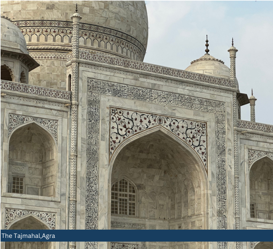
The Tajmahal, Agra