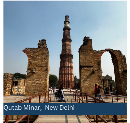
Qutab Minar, New Delhi