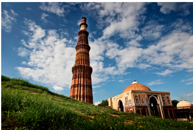
Qutab Minar, New Delhi

Später besuchen Sie den Qutub Minar, einen fünfstöckigen Turm aus Sandstein, der zum Gedenken an den Sieg von Muhammad Ghuri und Qutb-ud-Din über die ungläubigen Chauhans von Prithvi Raj im Jahr 1192 errichtet wurde. Der Turm wurde 1199 von Qutb-ud-Din erbaut, der später der erste Sultan von Delhi wurde, und er ist mit Zitaten aus dem Koran verziert. Übernachtung im Hotel.