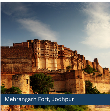
Mehrangarh Fort, Jodhpur